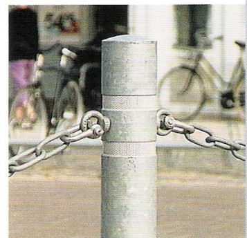
Design: Ark. Henning Bang